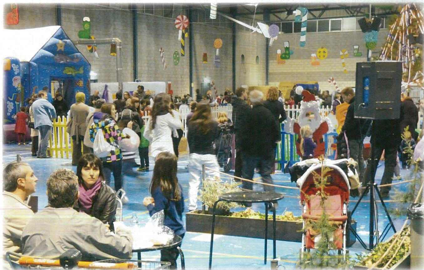
XXII Parc Infantil de Nadal