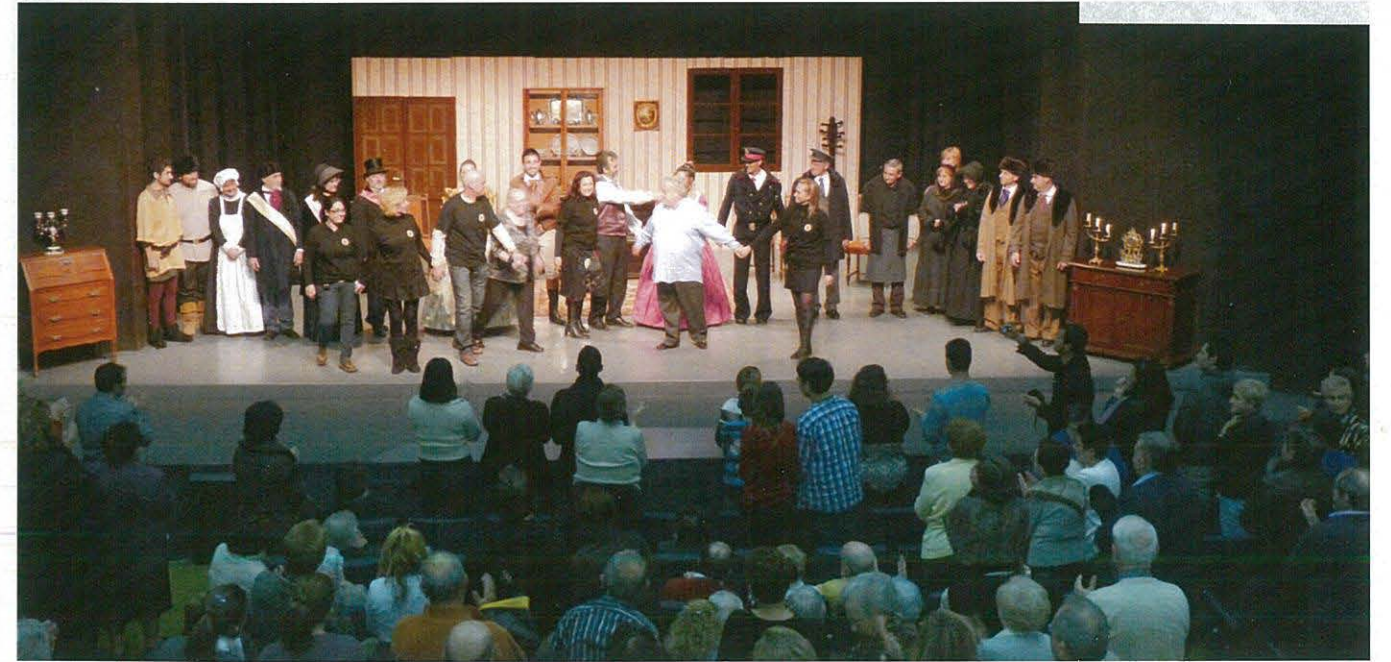
Gran èxit a la representació teatral, un cop finalitzada l'obra, forts aplaudiments del públic assistent que omplia la sala de gom a gom

BIBLIOTECA POPULAR EDIFICI CASA DE CULTURA 43550 ULLDECONA (TARRAGONA)