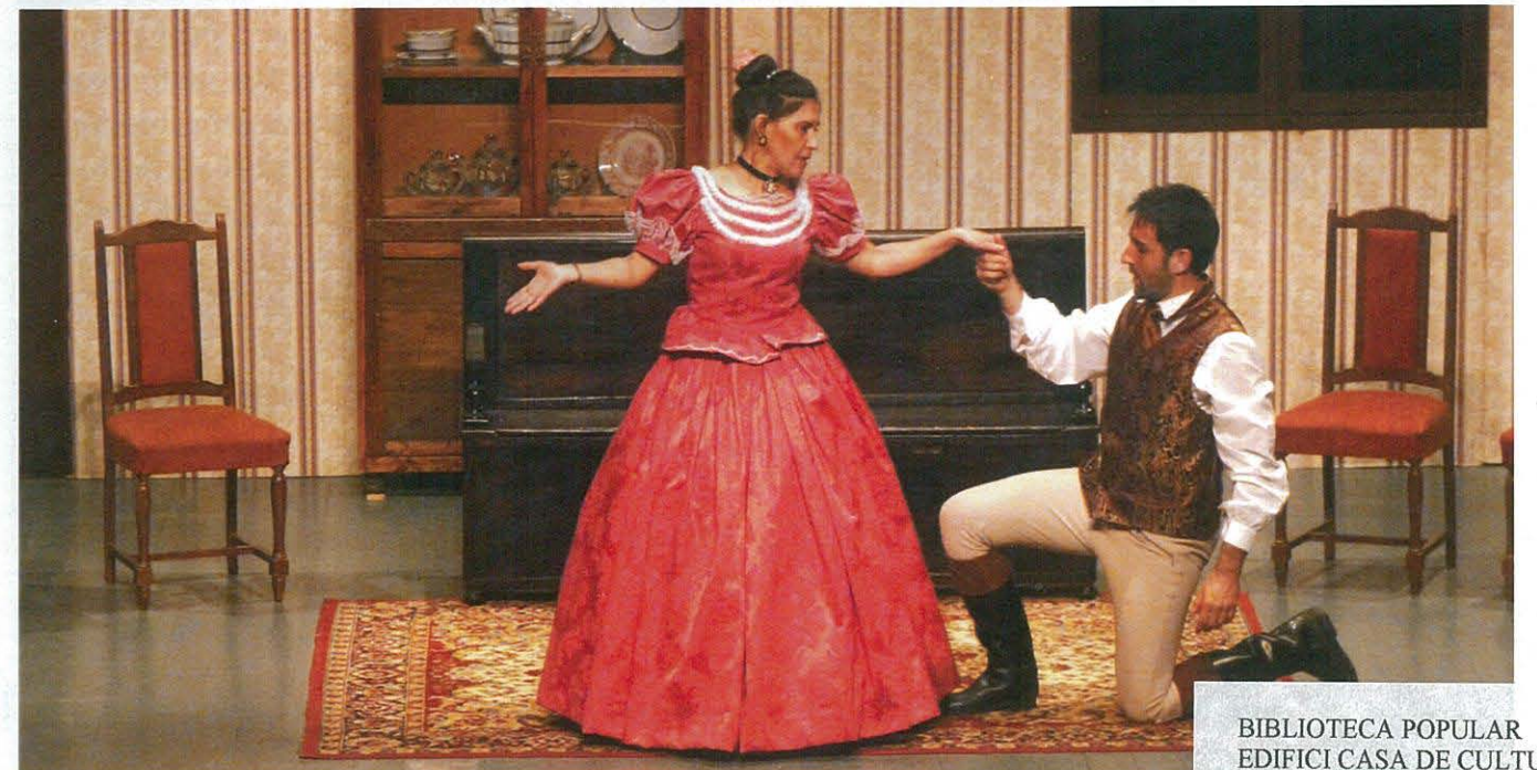
Representació de l'obra "L'INSPECTOR GENERAL"

BIBLIOTECA POPULAR EDIFICI CASA DE CULTURA 43550 ULLDECONA (TARRAGONA)